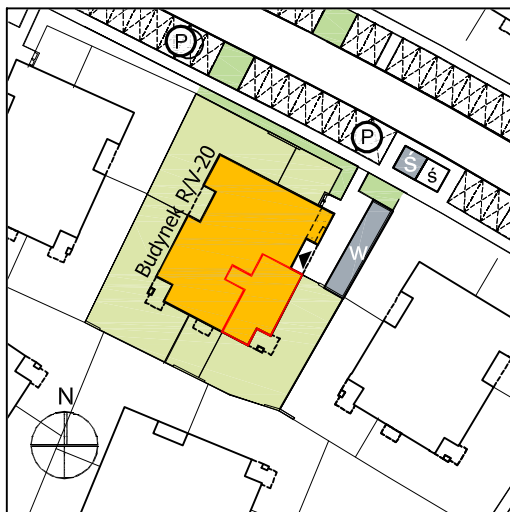
Lokalizacja budynku VILLA R/V-20