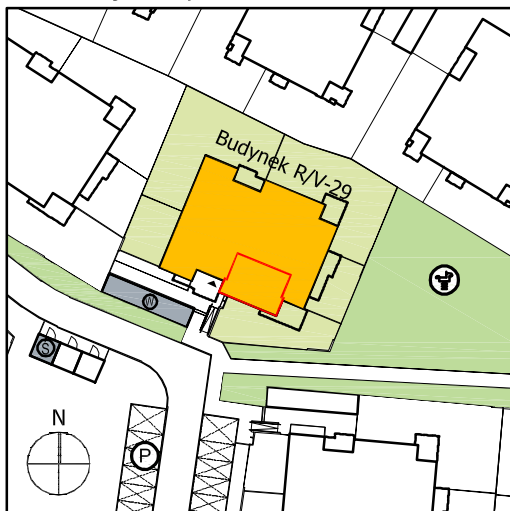
Lokalizacja budynku VILLA V-29